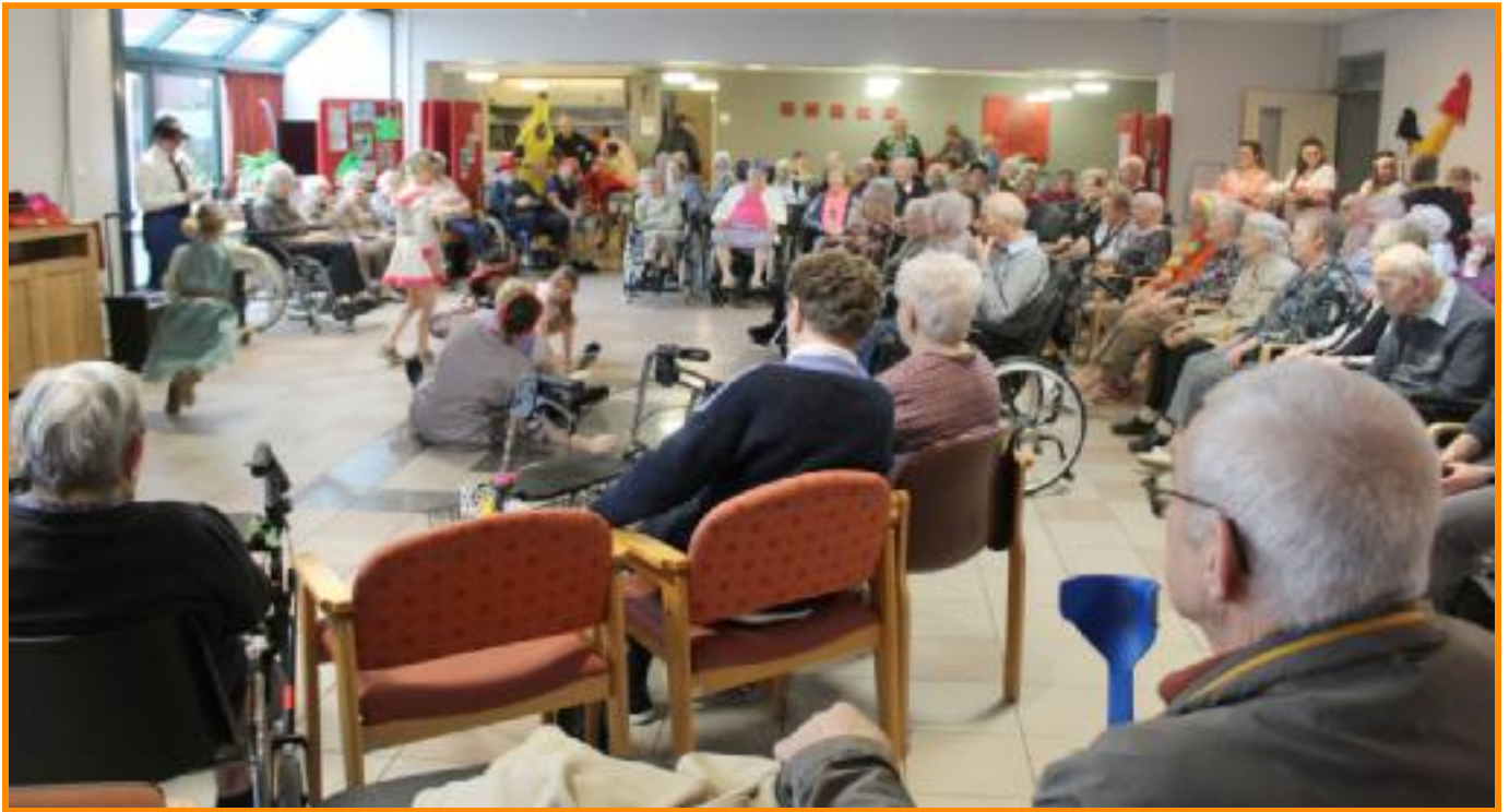
Leuke optredens op het free podium !